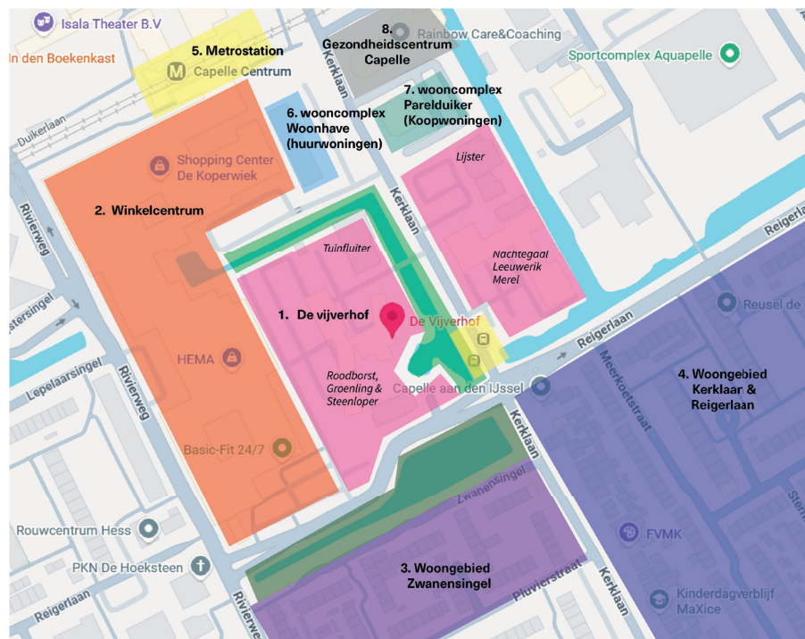
Fig 3. Kaart van omgeving ontwikkelgebied