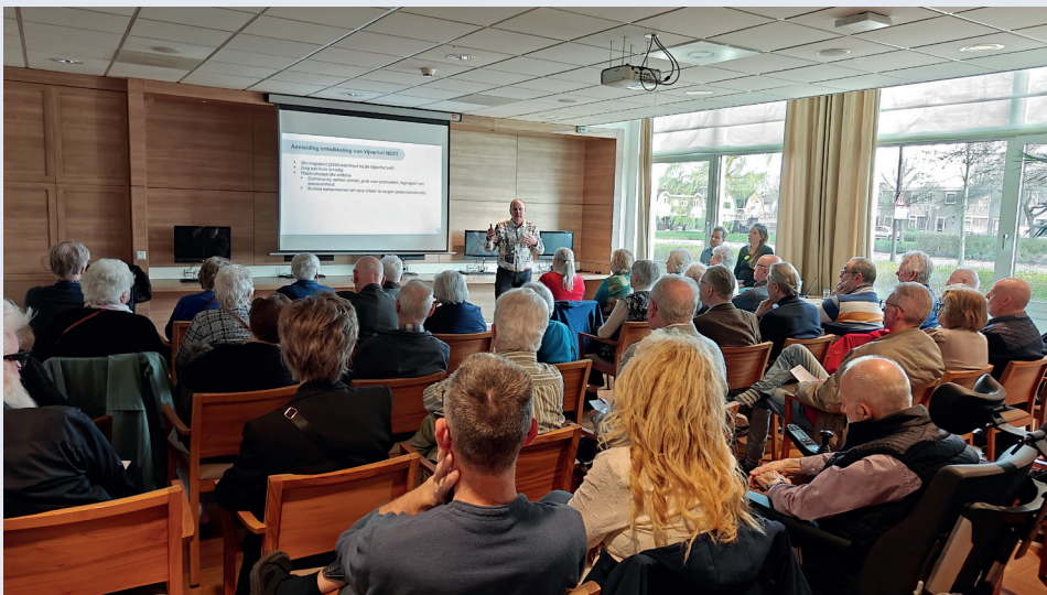
Foto: sfeerimpressie bewonersbijeenkomst 12 maart

In een volgende fase zal dit zich, met name op sociaal-maatschappelijke thema's, verder ontwikkelen richting co-creatie.