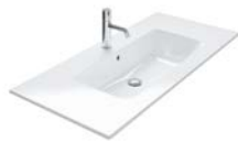
KERAMIEK 620 | 820 | 1020 | 1220 | 1420 MM

460 MM DIEP | 1 WASTAFELBLAD | 5 WASTAFELKASTEN