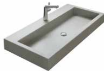
BETON 605 | 805 | 1005 | 1205 | 1405 | 1605 MM