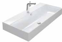
KERAMIEK 605 | 805 | 1005 | 1205 | 1405 | 1605 MM

460 MM DIEP | 3 WASTAFELBLADEN | 7 WASTAFELKASTEN