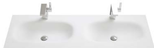
SOLID SURFACE | DOPPELWASCHBECKEN

Breiten Doppelwaschbecken: 1220 | 1420 | 1620 mm.