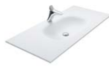
SOLID SURFACE 600 | 800 | 1020 | 1220 | 1420 | 1620 MM