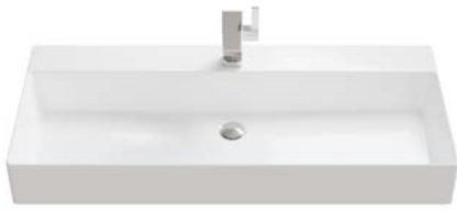
KERAMIK | EINZELWASCHBECKEN

Breiten Einzelwaschbecken: 600 | 800 | 1020 | 1220 mm.*