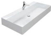
KERAMIK 600 | 800 | 1020 | 1220 | 1420 | 1620 MM