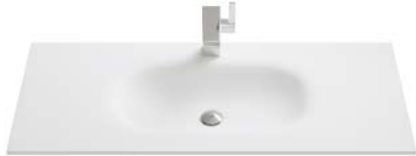
SOLID SURFACE | EINZELWASCHBECKEN

Breiten Einzelwaschbecken: 600 | 800 | 1020 mm.