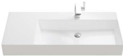
KERAMIK | ASYMMETRISCH LINKS VERLENGT

Breiten Waschbecken: 800 | 1020 | 1220 mm.*