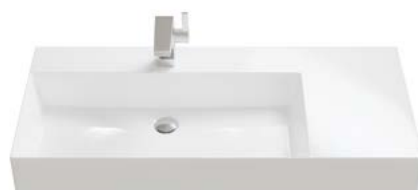
KERAMIK | ASYMMETRISCH RECHTS VERLENGT

Breiten Waschbecken: 800 | 1020 | 1220 mm.*