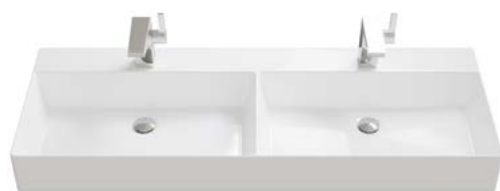
KERAMIK | DOPPELWASCHBECKEN

Breiten Doppelwaschbecken: 1220 | 1420 | 1620 mm.*