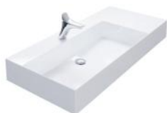
Keramik asymmetrisch 80, 102, 122 cm.