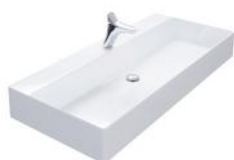
Keramik 60, 80, 102, 122, 142 cm.

Unser BLEND ist für jeden, der von der Norm abweichen möchte und das Abenteuer sucht, die perfekte Serie. Der Waschtischunterschrank sorgt für einen spielerischen "Touch" in Ihrem Badezimmer und komplettiert es mit einer dünnen Solid Surface Waschtischplatte. Ein Aufsatzbecken oder der strenge Keramik-Waschtisch verleihen dem ganzen Bild eine ausgereifte Ausstrahlung. In Kombination mit seinen „Tipmatic - Schubladen“ ist es für jeden Betrachter eine echte Augenweide.