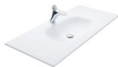
Solid Surface 60, 80, 102, 122, 142 cm.