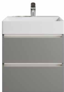
Typ B Grifflos, Kehrleiste inkl. LED Beleuchtung