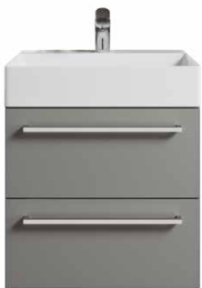
Typ D Knauf / Griff siehe Kapitel 14