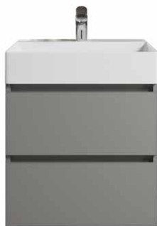
Typ C Grifflos, Kehrleiste in Korpusfarbe