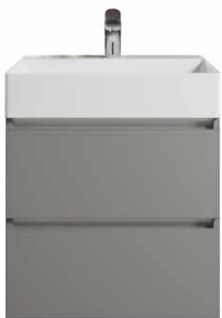
Typ A Grifflos, Kehrleiste in Aluminium