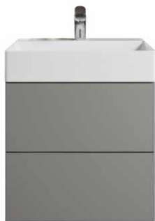
Typ F Tipmatic push-to-open