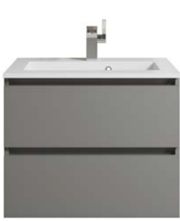
Typ C Grifflos, Kehrleiste in Korpusfarbe