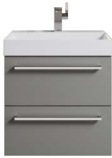
Typ D Knauf / Griff siehe Kapitel 14