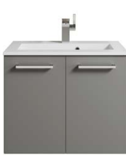
Türen Typ D Knauf / Griff siehe Kapitel 14