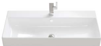
KERAMIK 1 | EINZELWASCHBECKEN

Breiten Einzelwaschbecken: 605 | 805 | 1005 | 1205 mm.*