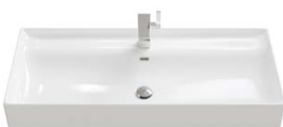
KERAMIK 2 | EINZELWASCHBECKEN

Breiten Einzelwaschbecken: 610 | 810 | 1010 | 1210 mm.*