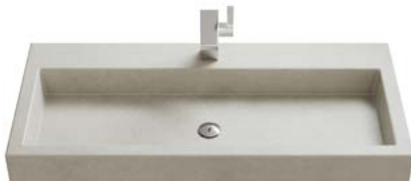
BETONBECKEN | EINZELWASCHBECKEN

Breiten Einzelwaschbecken: 605 | 805 | 1005 | 1205 mm.