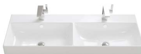
KERAMIK 1 | DOPPELWASCHBECKEN

Breiten Doppelwaschbecken: 1210 | 1410 | 1610 mm.*