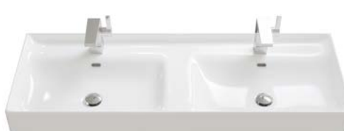
KERAMIK 2 | DOPPELWASCHBECKEN

Breiten Doppelwaschbecken: 1210 | 1410 | 1610 mm.*