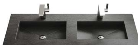
CERABLAD | DOPPELWASCHBECKEN

Breiten Doppelwaschbecken: 1205 | 1405 | 1605 mm.