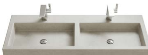
BETONBECKEN | DOPPELWASCHBECKEN

Breiten Doppelwaschbecken: 1205 | 1405 | 1605 mm.