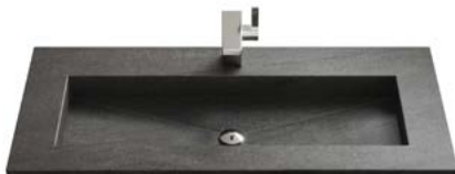
CERABLAD | EINZELWASCHBECKEN

Breiten Einzelwaschbecken: 605 | 805 | 1005 | 1205 mm.