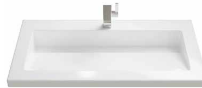
Mineralguss 1 70 | 90 | 105 | 120 | 140 cm.