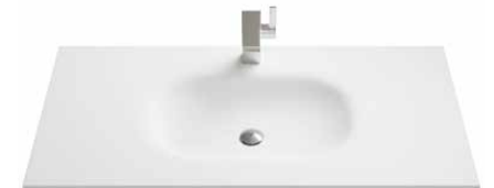
Solid Surface 70 | 90 | 105 | 120 | 140 cm.