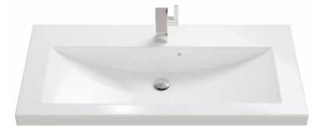
Mineralguss 2 70 | 90 | 105 | 120 | 140 cm.