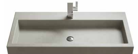
Beton (7 Farben) 71 | 91 | 106 | 121 | 141 cm.