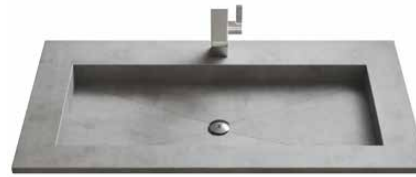
Cerablad (10 Farben) 70 | 90 | 105 | 120 | 140 cm.