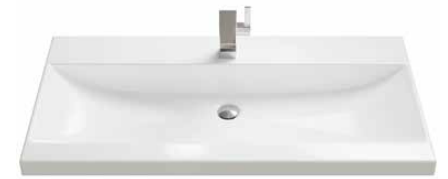
Keramik 2 71 | 91 | 106 | 121 | 141 cm.