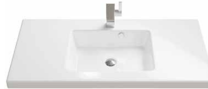
Keramik 1 71 | 91 | 106 | 121 | 141 cm.